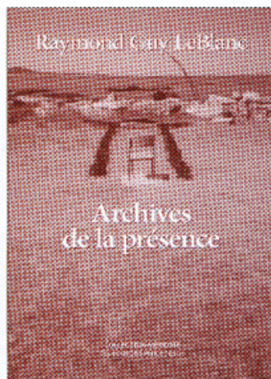
ARCHIVES DE LA PRÉSENCE Raymond Guy LeBlanc Perce-Neige