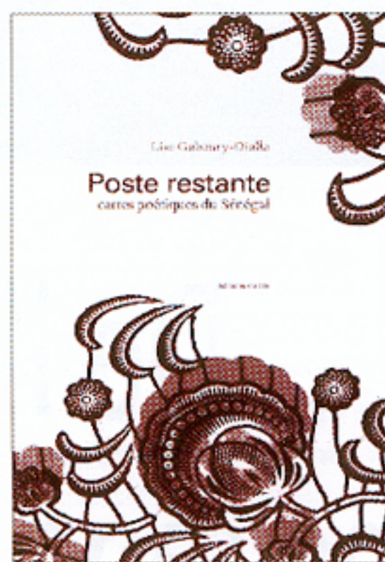
POSTE RESTANTE Lise Gaboury-Diallo Blé